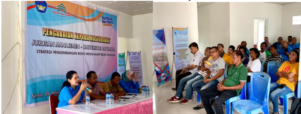
Gambar 4. (i)

Lingkungan lilibooi sekarang lebih sadar akan pentingnya pertukaran pengetahuan di antara para pemilik bisnis. Masyarakat telah menerima gagasan bahwa berbagi informasi bermanfaat bagi pemilik usaha lilibooi. Keinginan masyarakat untuk mengajukan pertanyaan selama percakapan setelah kegiatan adalah buktinya. Para pengusaha lilibooi telah menunjukkan rasa percaya diri dan keuletan. Masyarakat telah mendapatkan pemahaman tentang kewirausahaan melalui pembagian materi, sehingga tidak boleh hilang hanya karena satu kerugian. Kegiatan ini tidak diragukan lagi memiliki efek positif bagi para wirausahawan dan komunitas lilibooi, mendorong mereka yang telah memiliki bisnis untuk berbagi pengetahuan dan mengadopsi sikap tangguh dan percaya diri, serta menginspirasi mereka yang belum memulai bisnis mereka sendiri untuk memiliki keberanian dan kemauan untuk melakukannya.