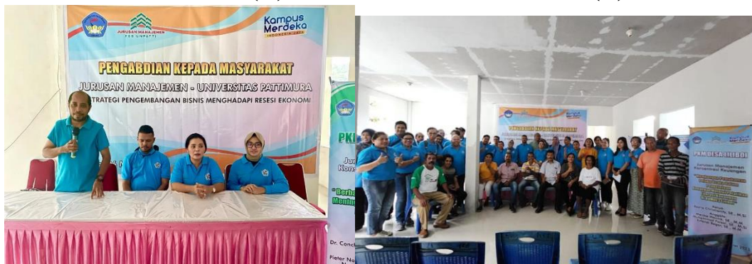
Gambar 4. (v)