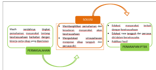
Gambar 1. Metode Penerapan Iptek

Kegiatan dengan tema "Edukasi wirausaha negeri Lilibooi: knowledge sharing upaya menciptakan inovasi" meliputi pembagian materi dan sesi tanya jawab dengan peserta.