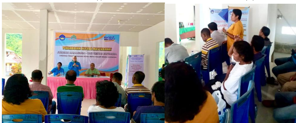
Gambar 4. (iii)