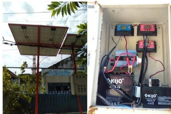
Gambar 4. Hasil Instalasi Sistem Panel Surya