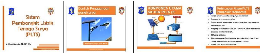
Gambar 1. Cuplikan Materi dalam Modul

Pelaksanaan pertemuan zoom hanya dihadiri oleh tim pengabdian dan Pak Njuk Sumardi sebagai pimpinan dan perwakilan warga. Pertemuan melalui zoom tidak dapat dihadiri oleh warga peserta pengabdian karena mengingat kemampuan ekonomi warga RT03 adalah menengah ke bawah, dengan kondisi type handphone yang dimiliki berbeda – beda yang belum tentu dapat menggunakan aplikasi zoom. Selain itu kebutuhan pembelian pulsa tambahan khusus untuk mengikuti pertemuan zoom akan memberatkan warga. Dari pertimbangan tersebut diputuskan oleh Pak Tjuk bahwa beliau yang akan mengikuti pemaparan materi sistem instalasi panel surya kemudian hasil rekaman pertemuan zoom dibagikan ke warga RT03 peserta pengabdian masyarakat. Apabila warga mempunyai pertanyaan tentang materi sistem instalasi panel surya disampaikan kepada pak Tjuk kemudian dijelaskan oleh tim pengabdian saat tatap muka dengan warga peserta pengabdian. Gambar 2 memperlihatkan pertemuan zoom tim abdimas dengan Pak Tjuk Sumardi sebagai wakil warga.