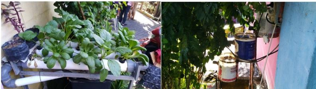
Gambar 5. Pompa Air Hydroponic Aktif dengan Tenaga Surya