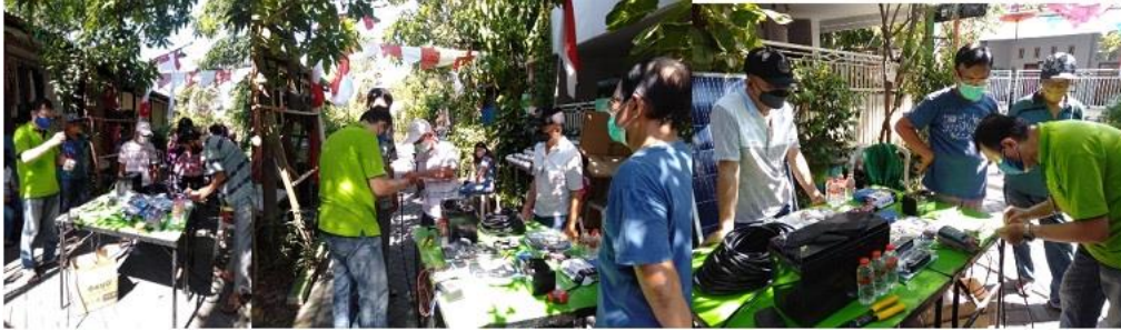
Gambar 3. Proses Instalasi Panel Surya

pengabdian terhadap sistem panel surya dimanfaatkan untuk pompa air tanaman hidroponik oleh warga RT03 RW 03 Tambak Segaran IV.