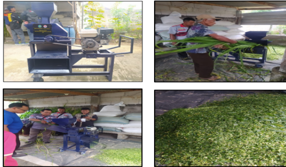
Gambar 2. Pengoperasian Mesin Chopper Multifungsi

Selain aspek teknis, kegiatan ini juga memberikan dampak sosial ekonomi yang signifikan. Pelibatan pemuda desa dalam pengoperasian mesin, pelatihan kewirausahaan, dan pengelolaan pakan menjadi sarana pemberdayaan generasi muda. Hal ini menumbuhkan jiwa inovatif dan kewirausahaan, memperkuat peran pemuda dalam pembangunan ekonomi lokal, serta meningkatkan daya saing kelompok peternak di pasar. Secara keseluruhan, integrasi teknologi tepat guna, pelatihan, dan pemanfaatan limbah pertanian telah menciptakan model peternakan yang efisien, berkelanjutan, dan memberdayakan masyarakat.