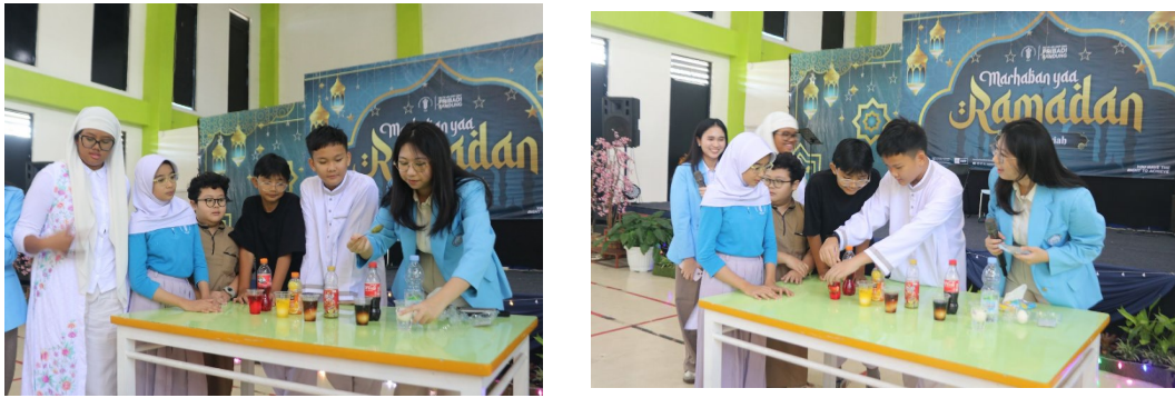
Gambar 2. Kegiatan Eksperimen