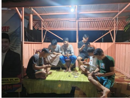
Gambar 1. Kegiatan Survei Penggiat Hobi Mobile Game