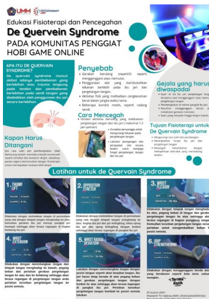
Gambar 5. Poster Penyuluhan