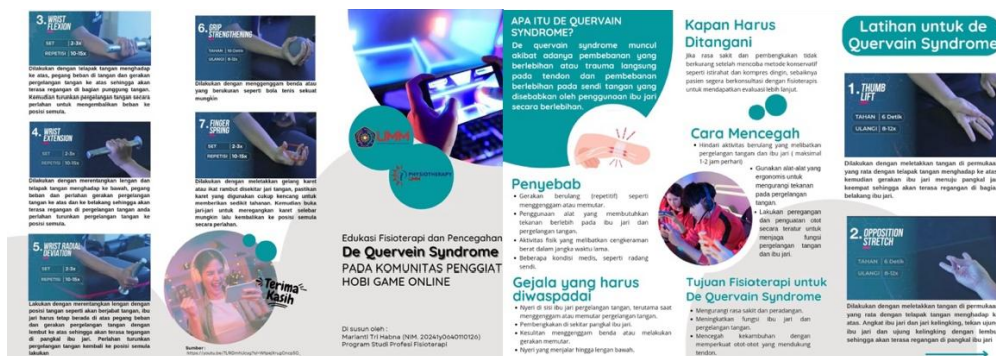
Gambar 4. Leaflet Penyuluhan

Upaya promosi Kesehatan ini menggunakan media leaflet dan poster A3 yang dibagikan kepada seluruh responden untuk memudahkan penerimaan materi yang diberikan oleh penyuluh.