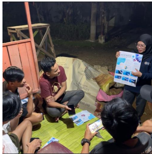
Gambar 2. Kegiatan Penyuluhan