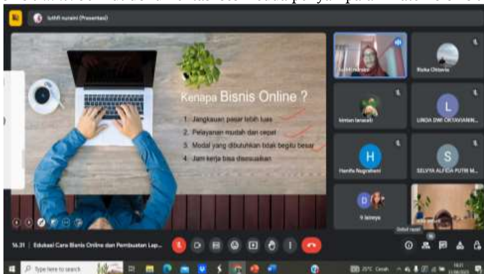
Gambar 2. Sesi Kedua Penyampaian Materi Bisnis Online

Sesi kedua kegiatan adalah penyampaian materi mengenai bisnis online oleh narasumber Luthfi Nuraini, S.Pd.,M.M. Dalam penyampaian materi ini peserta diberikan penjelasan mengenai alasan mengapa harus berbisnis online dimasa sekarang, apa yang harus dilakukan dalam berbisnis online , menganalisis produk yang ingin dijual secara online , online promotion , online selling , market research , test market dan pengenalan platform untuk bisnis online . berikut dokumentasi sesi kedua penyampaian materi bisnis online :