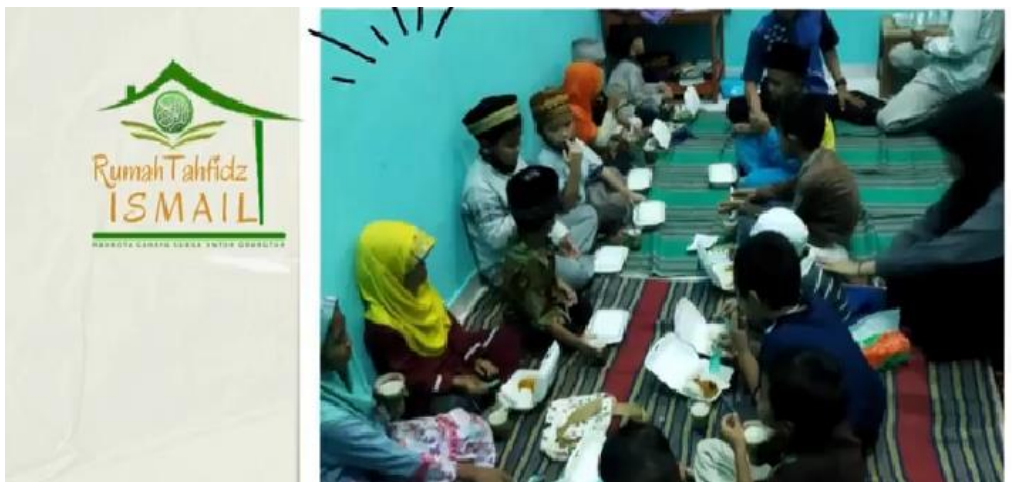
Gambar 1 Suasana di Rumah Tahfidz ISMAIL

Secara potensi, pengelola bersama relawan baik dari kalangan umum maupun orang tua/wali murid dapat diharapkan semangatnya dalam memperjuangkan keberlangsungan lembaga pendidikan tersebut. Dalam sebuah hadist dinyatakan bahwa 99 dari 100 pintu rizki berasal dari perdagangan. Pilihan untuk penggalan dana dari sector perdagangan ini cukup realistis sebagai solusi atas permasalahan yang dihadapi. perkembangan perekonomian dewasa ini sebenarnya menawarkan peluang bagi mereka yang menguasai paling tidak aspek dasar dari teknologi informasi. Meski begitu, hal ini belum diimbangi dengan ketrampilan yang menunjang khususnya dalam pemanfaatan pemasaran digital melalui marketplace . Akibatnya potensi tersebut belum termanfaatkan dengan optimal.