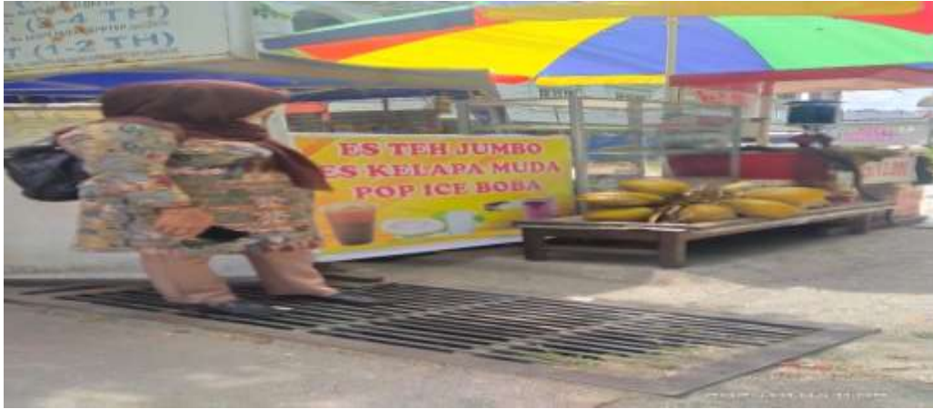
Gambar 3. Usaha Minuman Es Kelapa Muda dan Pombensin