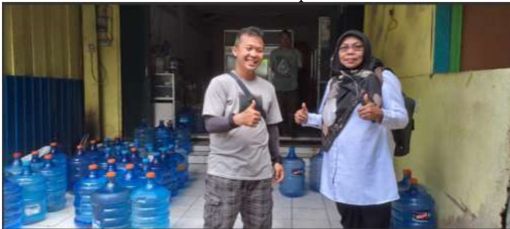
Gambar 4. Usaha Mikro Air Galon

Pelaksanaan PKM ini dimulai dari tahapan sebagaimana yang telah di sampaikan dalam metode pelaksanaan dimana: