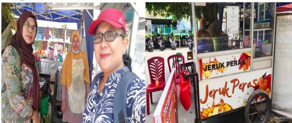
Gambar 2. Usaha Mikro Minuman Jerus Peras dan Popice

Para Alumni sebagai mitra diberikan arahan dan solusi mengenai strategi dalam pengembangan usaha peningkatan pengetahuan tentang manajemen usaha, ketrampilan dalam mengelola usaha dan pengendalian dalam pelaksanaan usaha. Peningkatan pengetahuan dan kompetensi spesifik yang diharapkan dari seseorang dalam ia melaksanakan fungsi, posisi dan peranannya di dunia kerja (Wa Ariadi1*, Mugiati2, Jatmika3, 2023). Gambaran Pelaksanaan PKM di tempat usaha para alumni tersebut adalah sebagai berikut: