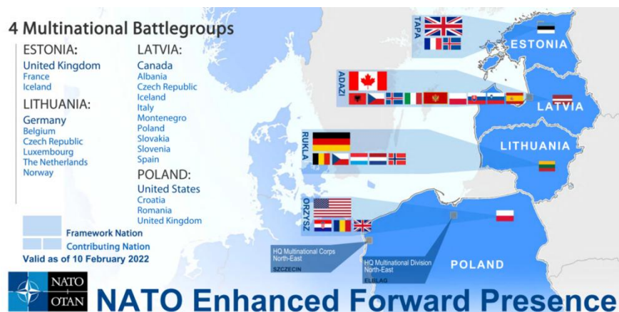
Gambar 3. Peta Empat Batalion Multinasional NATO