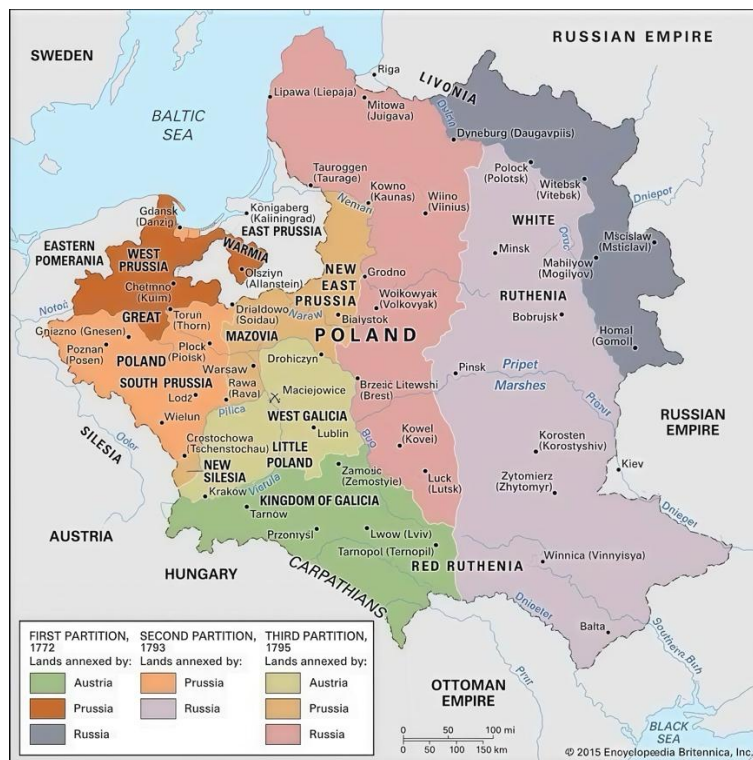
Gambar 1. Peta Geografis Polandia