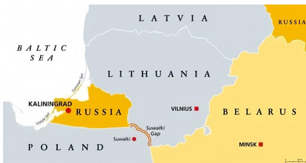
Gambar 2. Peta Suwałki Land Corridor

Konfigurasi ancaman dua arah ini kemudian menempatkan Koridor Suwałki ( Suwałki Land Corridor ) sebagai kawasan yang sangat strategis sekaligus rentan dalam sistem pertahanan NATO. Koridor Suwałki merupakan jalur darat sepanjang sekitar 65 hingga 100 kilometer yang menghubungkan Polandia dengan Lithuania, dan menjadi satu-satunya akses darat NATO menuju negara-negara Baltik (Parafianowicz, 2017). Posisi geografisnya yang berada tepat di antara Kaliningrad Oblast dan Belarus menyebabkan kawasan ini dipandang rentan, karena berpotensi menjadi titik pemutusan akses NATO menuju kawasan Baltik apabila terjadi eskalasi konflik dengan Rusia.