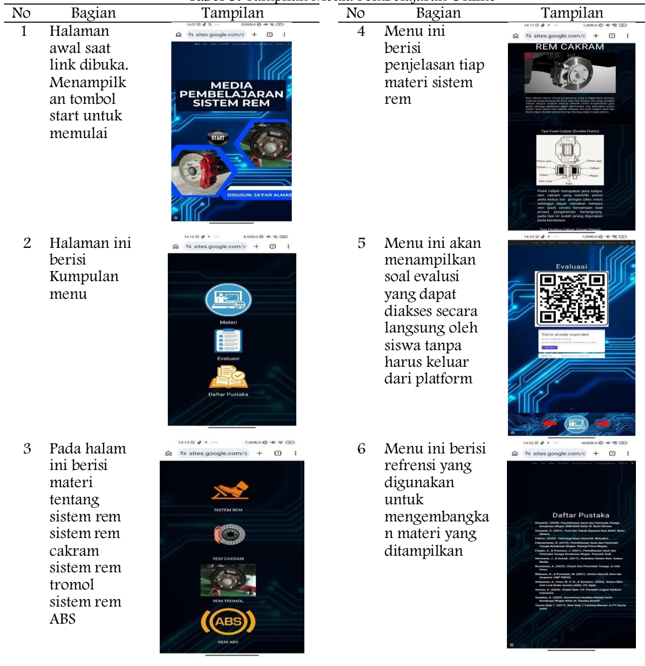
Tabel 3. Tampilan Media Pembelajaran Online

Teori Cognitive Theory of Multimedia Learning dari Mayer (2021) menjelaskan bahwa peserta didik akan lebih mudah memahami materi apabila informasi disajikan melalui kombinasi teks, gambar, animasi, maupun video dibandingkan hanya menggunakan teks saja. Oleh karena itu, integrasi berbagai media pada Google Sites dapat membantu mengurangi beban kognitif siswa sekaligus meningkatkan pemahaman konsep sistem rem.