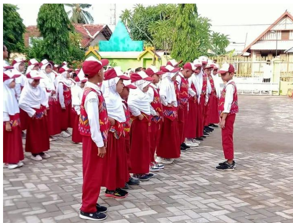
Gambar 2. Kegiatan Upacara Bendera

Temuan wawancara dengan Ibu Mariani selaku guru kelas 4A menunjukkan bahwa penekanan terhadap penggunaan topi, dasi, dan kelengkapan upacara lainnya merupakan bagian dari strategi sekolah dalam membentuk perilaku disiplin siswa. Guru menyatakan bahwa aturan tersebut bukan sekadar formalitas, melainkan sarana untuk melatih tanggung jawab dan kepatuhan siswa terhadap aturan sekolah. Apabila terdapat siswa yang belum menggunakan atribut secara lengkap, sekolah memberikan teguran lisan terlebih dahulu sebagai bentuk pembinaan awal.