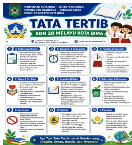
Gambar 3. Tata Tertib SDN 28 Melayu Kota Bima

Secara teoretis, praktik pembinaan tersebut dapat dipahami melalui teori peran guru sebagai motivator dan pembimbing dalam proses pendidikan. Guru tidak hanya berfungsi sebagai penyampai materi pembelajaran, tetapi juga memiliki tanggung jawab untuk membimbing, mengarahkan, memberi nasihat, serta menumbuhkan semangat belajar peserta didik. Dalam konteks ini, arahan yang diberikan guru kepada siswa merupakan bagian dari upaya membangun motivasi, kedisiplinan, dan tanggung jawab belajar secara berkelanjutan. Pandangan tersebut sejalan dengan penelitian tentang peran guru dalam meningkatkan motivasi belajar siswa sekolah dasar, yang menunjukkan bahwa guru memiliki peran penting dalam mendorong siswa agar lebih rajin belajar melalui pemberian motivasi, dorongan, serta strategi pembelajaran yang disesuaikan dengan kebutuhan peserta didik. Guru juga berperan sebagai motivator, fasilitator, dan pembimbing yang membantu siswa tetap terarah dalam mengikuti proses pembelajaran (Arini Sakinah, 2023).