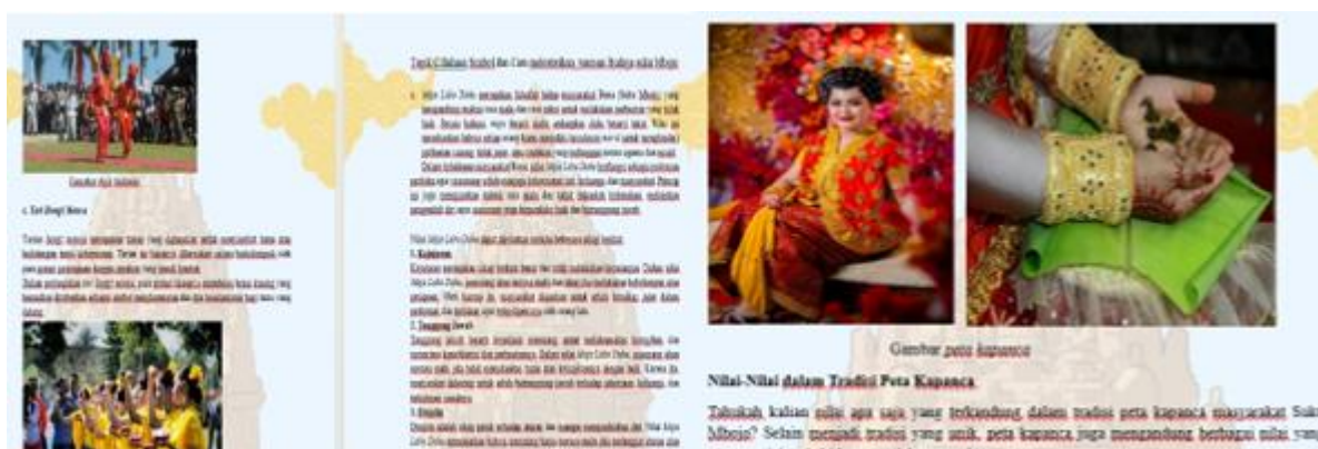
Gambar 3. Bagian isi materi yang dikembangkan

Selain merancang produk bahan ajar, pada tahap ini juga disusun instrumen penelitian yang meliputi lembar validasi ahli materi dan ahli media, angket respon guru dan siswa, tes pemahaman konsep sosial, serta lembar observasi pembelajaran. Instrumen tersebut dirancang untuk memperoleh data mengenai validitas, kepraktisan, dan efektivitas bahan ajar yang dikembangkan.