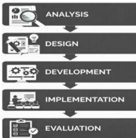
Gambar 2. Tahapan Penelitian Model ADDIE

Penelitian ini menggunakan metode Research and Development (R&D) dengan model ADDIE yang meliputi tahap analysis, design, development, implementation, dan evaluation (Nitami et al. , 2023). Penelitian bertujuan menghasilkan bahan ajar berbasis etno-sosial Bima yang valid, praktis, dan efektif untuk meningkatkan pemahaman konsep sosial siswa kelas IV pada materi “Indonesiaku Kaya Budaya”. Penelitian dilaksanakan di SDN Belo dengan melibatkan 15 siswa kelas IV, ahli materi, ahli media, dan guru kelas.