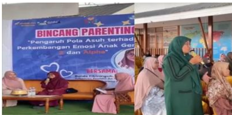
Gambar 1. Dokumentasi Kegiatan Parenting SD Islam Cahaya Khalifah Palu

Kepala sekolah menjelaskan bahwa Program MABIT menjadi wadah pembinaan spiritual dan penguatan karakter peserta didik yang dilaksanakan dalam suasana kebersamaan dan kekeluargaan. Program ini menekankan pentingnya sinergi antara sekolah dan orang tua agar pembinaan akhlak tidak hanya berlangsung di sekolah, tetapi juga diterapkan dalam kehidupan sehari-hari di lingkungan keluarga. Oleh sebab itu, keterlibatan aktif orang tua sejak tahap perencanaan dipandang sebagai faktor penting dalam menunjang keberhasilan Program MABIT sebagai sarana pembentukan akhlak peserta didik.