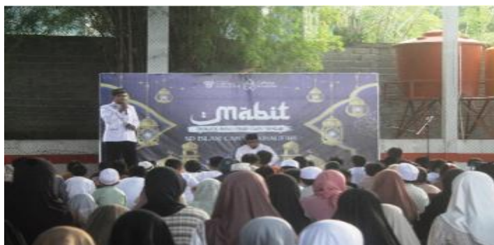
Gambar 8. Dokumentasi Ustadz Memberikan Pesan Agama

Keterlibatan masyarakat dalam Program MABIT juga memperluas dukungan spiritual bagi peserta didik. Lingkungan sosial yang mendukung penerapan nilai-nilai Islam memberikan pengaruh positif terhadap perkembangan karakter dan perilaku peserta didik. Dengan adanya sinergi antara sekolah, keluarga, dan masyarakat, proses pembentukan akhlak tidak hanya berlangsung di lingkungan sekolah, tetapi juga diperkuat oleh lingkungan sosial yang lebih luas. Kolaborasi tersebut menciptakan suasana pendidikan yang mendukung internalisasi nilai-nilai Islam dalam kehidupan peserta didik. Melalui dukungan bersama dari guru, orang tua, dan tokoh masyarakat, peserta didik diharapkan mampu mengembangkan sikap religius, disiplin, bertanggung jawab, peduli terhadap sesama, serta memiliki akhlak mulia yang tercermin dalam perilaku sehari-hari.