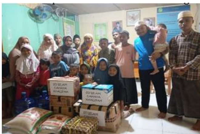
Gambar 4. Dokumentasi Penyaluran Sembako ke Panti Asuhan dan Masjid

Kolaborasi antara guru PAI dan orang tua juga berlanjut pada tahap tindak lanjut agar nilai-nilai akhlak yang telah ditanamkan melalui Program MABIT dapat terus berkembang dalam kehidupan sehari-hari peserta didik. Di lingkungan sekolah, tindak lanjut diwujudkan melalui berbagai pembiasaan positif, seperti pelaksanaan salat Zuhur dan Dhuha berjamaah, tilawah Al-Qur'an setiap pagi sebelum pembelajaran dimulai, pembiasaan adab sehari-hari seperti berjabat tangan dengan guru dan menjaga sopan santun, serta kegiatan sosial melalui program infak dan bantuan kepada panti asuhan maupun masjid. Guru PAI menjelaskan bahwa tindak lanjut tersebut bertujuan menjaga dan memperkuat kebiasaan baik yang telah dibentuk selama kegiatan MABIT agar menjadi karakter yang melekat pada diri peserta didik. Pembiasaan yang dilakukan secara berkelanjutan diharapkan mampu membentuk perilaku Islami yang diterapkan tidak hanya di sekolah, tetapi juga dalam kehidupan sehari-hari di rumah dan lingkungan masyarakat.