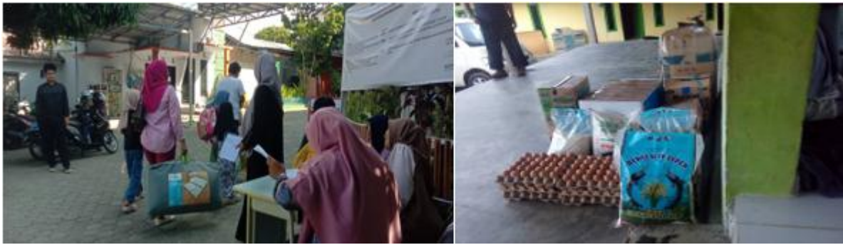
Gambar 6. Dokumentasi Bantuan Logistik dan Pendampingan Orang Tua terhadap Peserta Didik

Keterlibatan orang tua yang dilakukan secara aktif dan sukarela menciptakan suasana yang mendukung kelancaran pelaksanaan Program MABIT. Peserta didik dapat mengikuti kegiatan dengan lebih nyaman, tertib, dan antusias karena memperoleh dukungan penuh dari keluarga. Situasi tersebut memberikan pengalaman spiritual yang berkesan bagi peserta didik sekaligus memperkuat penanaman nilai-nilai Islami, seperti disiplin, tanggung jawab, kepedulian sosial, dan semangat beribadah dalam kehidupan sehari-hari.