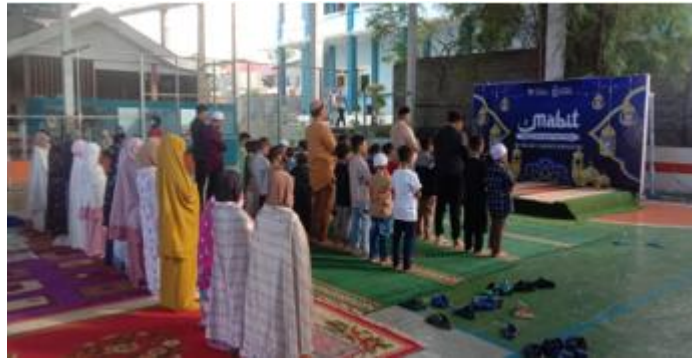
Gambar 3. Dokumentasi Salat Ashar Berjamaah dalam Kegiatan MABIT

Program Malam Bina Iman dan Takwa (MABIT) tahun 2025 di SD Islam Cahaya Khalifah Palu mengangkat tema “Hatiku Bersinar, Akhlakku Qur’ani: Mengamalkan Adab dari Kalam Ilahi.” Tema tersebut menjadi dasar dalam seluruh rangkaian kegiatan yang diarahkan pada penguatan spiritual dan pembentukan akhlak Islami peserta didik. Guru Pendidikan Agama Islam (PAI) bersama orang tua memiliki tujuan yang sejalan dalam mendukung pembinaan karakter peserta didik sehingga terjalin kerja sama yang harmonis antara pihak sekolah dan keluarga dalam proses pendidikan akhlak. Salah satu kegiatan penting dalam pelaksanaan MABIT adalah penyaluran donasi kepada panti asuhan yang diawali dengan tausiyah tentang pentingnya keimanan, kepedulian sosial, dan kebiasaan bersedekah dalam kehidupan seorang muslim. Keterlibatan orang tua dalam kegiatan tersebut menunjukkan adanya kerja sama nyata antara sekolah dan keluarga dalam menanamkan nilai empati, kepedulian, dan semangat berbagi kepada peserta didik. Dukungan orang tua tidak hanya berbentuk material, tetapi juga berupa keteladanan dalam membangun karakter sosial dan spiritual anak.