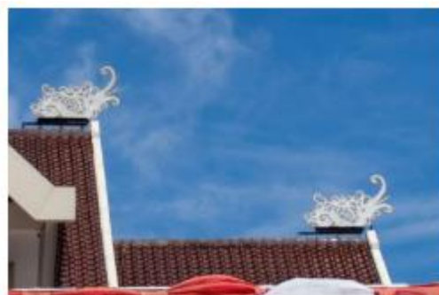
Gambar 5. Ornamen burung enggang pada puncak atap GSG Sangatta, ukuran 1,5m × 0,5m, material plat besi 10mm, ketinggian 12 meter

Sense of place merupakan prinsip puncak Critical Regionalism yang mengukur kemampuan arsitektur menciptakan keterikatan emosional antara pengguna dan tempat. GSG Sangatta mencapai capaian tertinggi dengan kesepakatan 97,2%. Ornamen burung enggang yang ditempatkan eksklusif pada bangunan pemerintah dan rumah adat memberikan legitimasi kultural yang mengangkat GSG Sangatta menjadi landmark identitas resmi komunitas Dayak Kenyah di Kutai Timur.