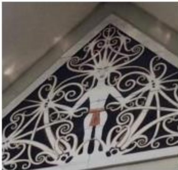
Gambar 2. Detail ornamen motif figur manusia pada fasad segitiga atap GSG Sangatta, ukuran 1,5m × 0,3m, material plat besi 4mm

Frampton (1983) menetapkan bahwa arsitektur kritis harus secara aktif melawan homogenisasi global dengan menghadirkan nilai-nilai tempatan yang autentik dan tidak tergantikan. Pada GSG Sangatta, penempatan ornamen figur manusia, pucuk paku, dan burung enggang pada atap merupakan pernyataan arsitektural yang tegas terhadap dominasi arsitektur modern internasional yang seragam. Evaluasi 15 responden menunjukkan tingkat kesepakatan 96,3%, mengonfirmasi bahwa ornamen atap berhasil memenuhi prinsip ini. Namun evaluasi ini perlu dikritisi lebih dalam. Canizaro (2007) menegaskan bahwa resistensi terhadap homogenisasi tidak cukup ditunjukkan melalui kehadiran simbol visual simbol tersebut harus mampu menyampaikan makna yang dapat dirasakan masyarakat secara luas. Fakta bahwa pengguna awam mengakui ornamen sebagai identitas Dayak tetapi tidak memahami maknanya secara mendalam mengindikasikan bahwa resistensi GSG Sangatta baru terjadi pada lapisan permukaan, belum menjangkau kedalaman kultural yang dituntut Frampton.