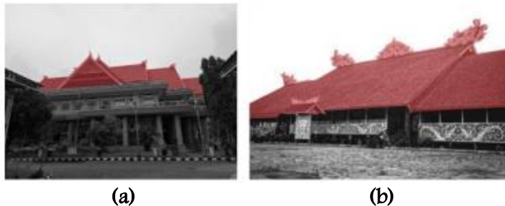
Gambar 1. Perbandingan bentuk atap (a) GSG Sangatta dan (b) Rumah Lamin Dayak Kenyah

Gedung Serbaguna (GSG) Sangatta menerapkan tiga motif ornamen Dayak Kenyah pada elemen atapnya secara hierarkis: motif figur manusia pada fasad segitiga atap, motif pucuk paku pada tepi atap dan segitiga atap, dan motif burung enggang pada puncak atap. Penempatan hierarkis ini bukan keputusan estetis semata, melainkan reproduksi sistem simbolik Rumah Lamin Dayak Kenyah yang menempatkan simbol paling sakral pada posisi tertinggi bangunan. Atap pelana memanjang dengan bentang 100 meter dan kemiringan proporsi bangunan menjadi kanvas utama ekspresi identitas lokal tersebut.