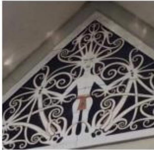
Gambar 4. Detail ornamen pucuk paku pada tepi atap GSG Sangatta, luas 15m 2 , material plat besi 4mm